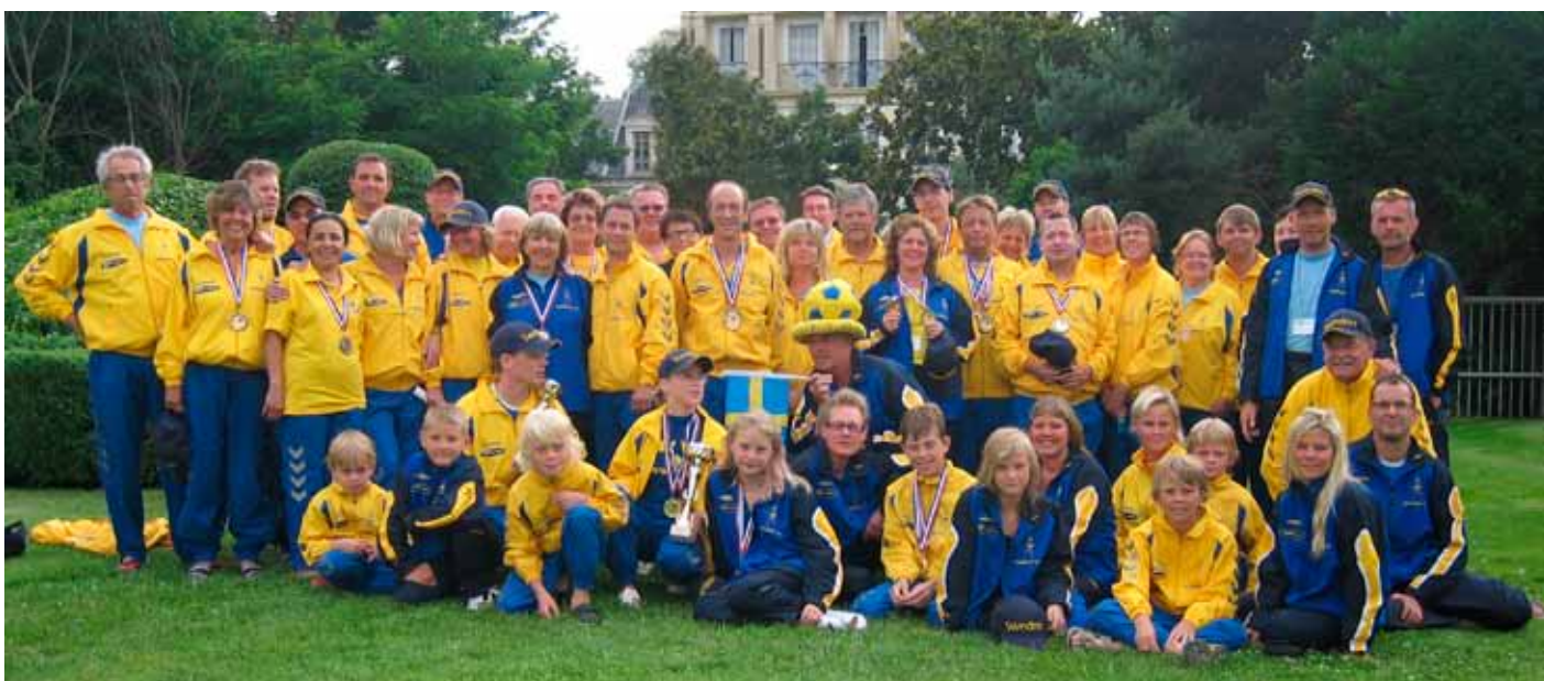
Hela Viking-gänget, tävlande och anhöriga