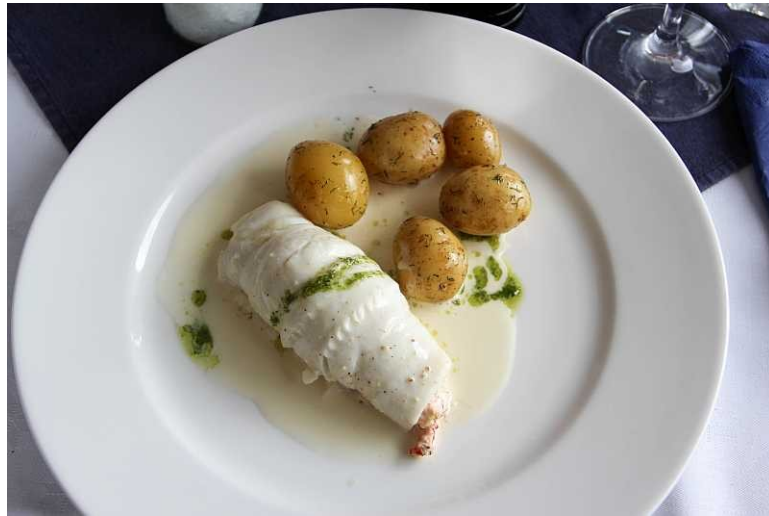
Skaldjursfylld rödspätta med vitvinssås